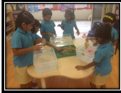
தேர்ந்தெடுக்கப்பட்ட பொருள்களைத் தண்ணீரில் போட்டுப் பார்த்தல்

2.6 பொருள்கள் தண்ணீரில் மிதக்கின்றனவா மூழ்குகின்றனவா என்பதையும் பிள்ளைகள் கண்டறிந்தார்கள். மேலும், கூடு வட்டமாக இருப்பதற்கான காரணத்தையும் கண்டறிந்தார்கள்.