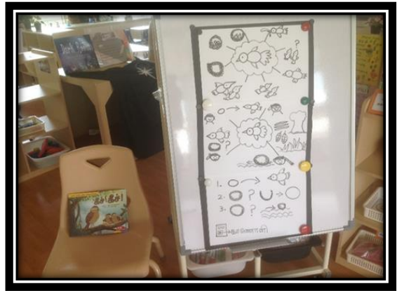
ஆசிரியர்களும் பிள்ளைகளும் சேர்ந்து உருவாக்கிய வலைப்பின்னல்