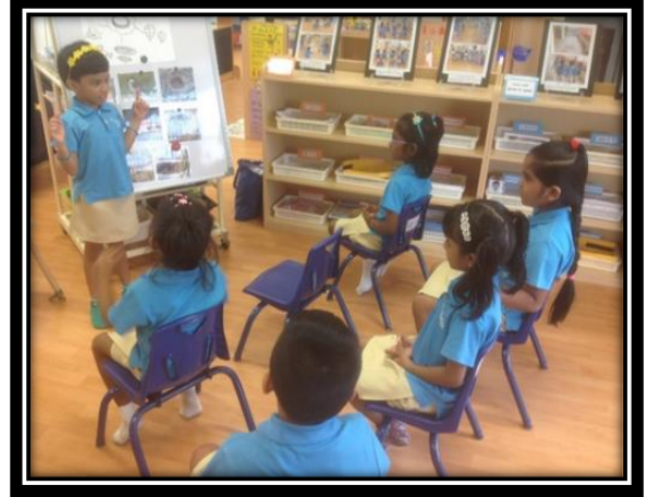
பிள்ளைகள் கூடு கட்டுவதற்குத் தேவையான பொருள்களைப்பற்றிக் கலந்துரையாடுதல்