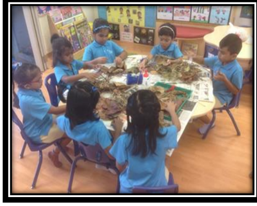
பிள்ளைகள் கூடு கட்டுவதற்குத் தேவையான பொருள்களைத் தொட்டுப் பார்த்தல்

2.5 பின்னர், கூடு கட்டுவதற்குத் தேவையான பொருள்களைச் சேகரித்தார்கள்.