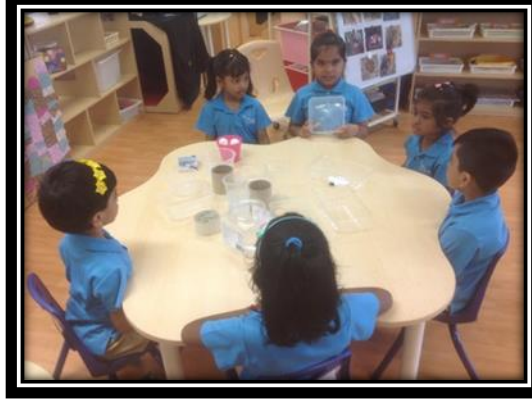
பிள்ளைகள் பொருள்களின் வடிவத்தைப்பற்றிக் கலந்துரையாடுதல்

2.3 பிள்ளைகள் பல வடிவத்திலுள்ள பிளாஸ்டிக் கலன்களையும், சிறிய பந்துகளையும் பயன்படுத்திக் கூடு வட்டமாக இருப்பதற்கான காரணத்தைக் கண்டறிந்தார்கள்.