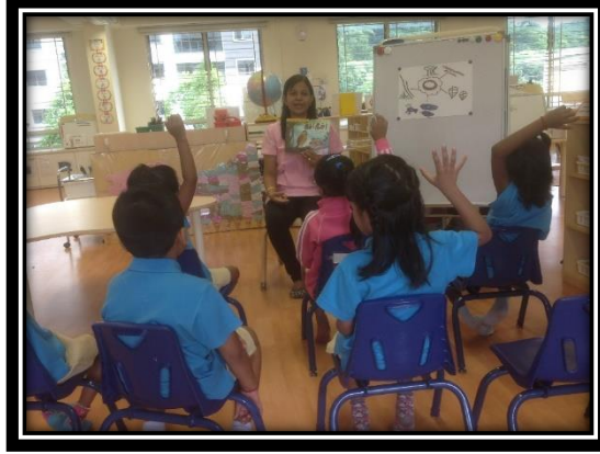
ஆசிரியர் கதைநூலைப்பற்றிப் பிள்ளைகளிடம் கலந்துரையாடுதல்