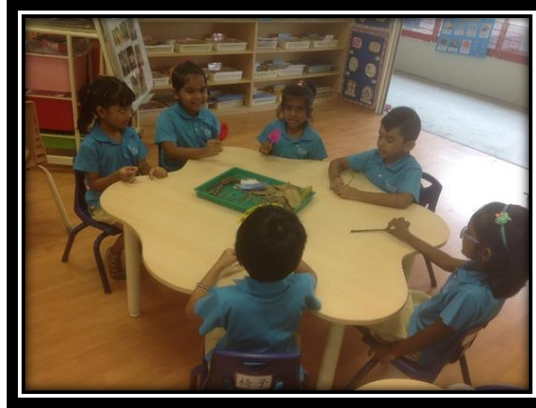
பிள்ளைகள் கூடு கட்டுவதற்குத் தேவையான பொருள்களைப்பற்றிக் கலந்துரையாடுதல்

2.4 காய்ந்த இலை, புல், இறகு, மரக்குச்சி போன்ற பொருள்கள் கூடு கட்டுவதற்குத் தேவை என்று பிள்ளைகள் சொன்னார்கள்.