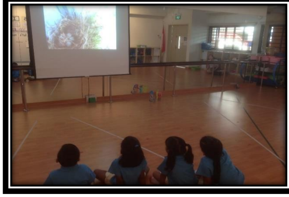
பிள்ளைகள் ஒளிக்காட்சியைப் பார்த்தல்

2.1 பிள்ளைகள் ஒளிக்காட்சி வழியாக முட்டைக் கருவிலிருந்து குருவிக்குஞ்சு உருவாகுவதையும் சிட்டுக்குருவி கூடு ஒன்று கட்டுவதையும் பார்த்தார்கள். சிட்டுக்குருவி சருகு, புல், இறகு, மரக்குச்சிப் போன்றவற்றைப் பயன்படுத்திக் கூடு கட்டுகிறது என்பதை அறிந்துகொண்டார்கள்.