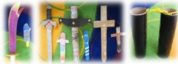
幼儿与父母一起制作的“兵器”

幼儿通过几堂课的探索，对兵器已有认识。教师让幼儿回家和父母一起用可再循环物品制作了不同的“兵器”，带来学校与同伴分享。在分享的过程中，幼儿讲述了各自“兵器”的制作过程，并用自制“兵器”现场做出武术动作。