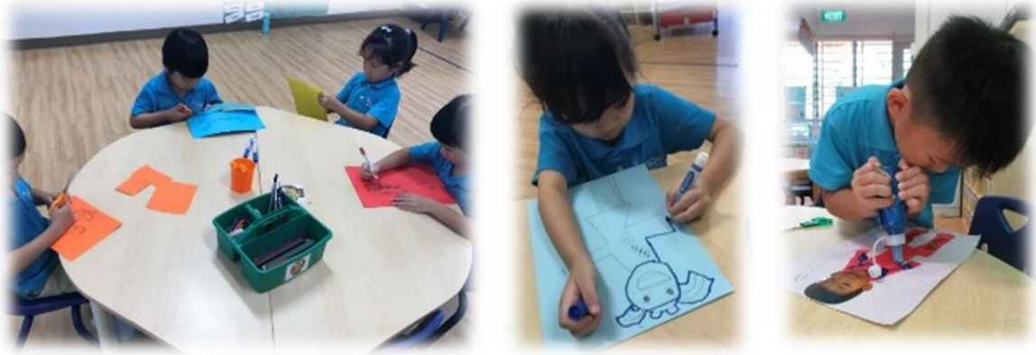
幼儿尝试设计自己的武术服。

从观察和聆听教练的讲解中，幼儿知道练武术的衣服叫武术服。它有很多颜色，有些上面还有龙的图腾。武术服的盘扣有的在中间，有的在旁边。