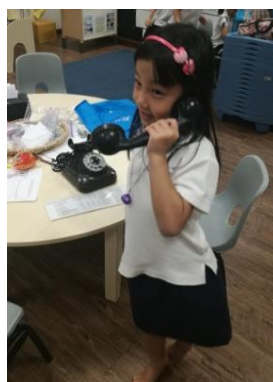
幼儿“打电话”给自己的爸爸妈妈