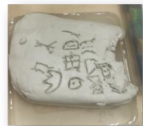
幼儿尝试在“石头”上仿写甲骨文