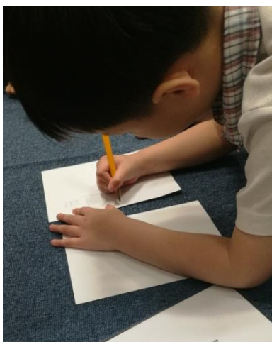
幼儿尝试制作“飞鸽传书”