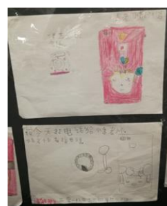
幼儿写给朋友和老师的书信图文并茂