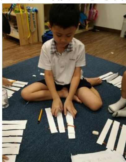
幼儿自己制作的竹简