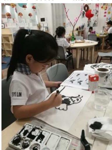
幼儿模仿古人用毛笔写字