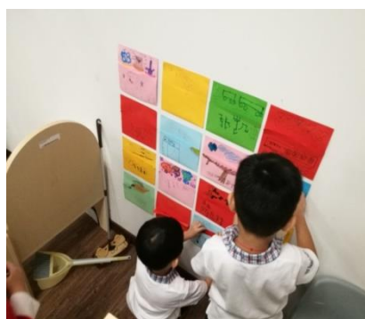
幼儿利用班里的“邮箱”进行写信体验